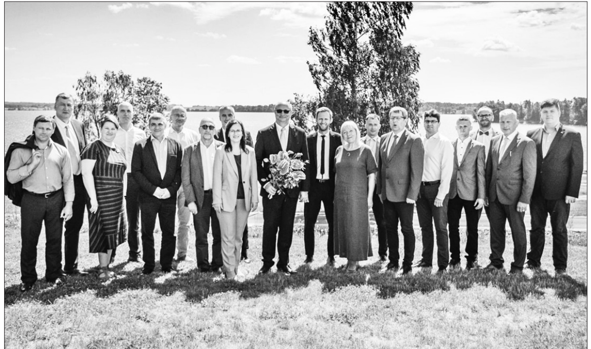
DOMES SĀKUSI DARBU. Jaunajā Aizkraukles novada domē ievēlēti 19 deputāti no līdzšinējiem Aizkraukles, Jaunjelgavas, Kokneses, Neretas, Pļaviņu un Skrīveru novadiem. Notikušas jau divas domes ārkārtas sēdes, kurās lemti jaunajam novadam svarīgi jautājumi. Domes vadība sola, ka pakalpojumu pieejamība iedzīvotājiem arī turpmāk tiks nodrošināta katrā pilsētā un pagastā tāpat kā līdz šim.